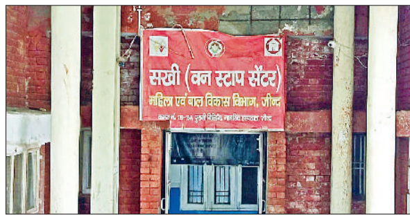
जीद। नागरिक अस्पताल की पुरानी बिल्डिंग में चल रहा वन स्टाप सेंटर।

खास बातें ■ सेंटर की जगह एमआरआई मशीन लगाने की योजना ■ मरीजों को अन्य जिलों के नहीं काटने पड़ेंगे चक्कर ■ एमडी एनएचएम ने दिए अधिकारियों को आदेश