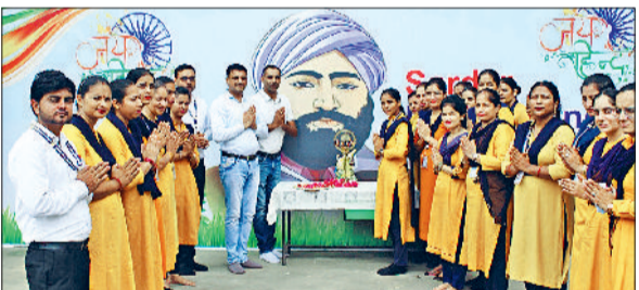
शिक्षा भारती स्कूल में मनाई शहीद उधम सिंह जयंती