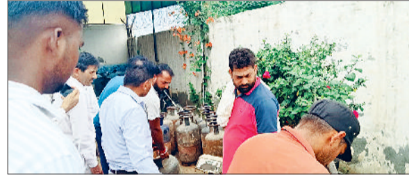
जींद। जांच करते टीम।

सीएम फ्लाइंग तथा खाद्य एवं आपूर्ति विभाग की संयुक्त टीम द्वारा शुक्रवार का गांव घसो कलां के निकट गैस गोदाम पर की गई छापेमारी के दौरान स्टॉक में भारी अनियमितता समेत अन्य खामियां पाई गईं। सीएम फ्लाइंग द्वारा छापेमारी की विस्तृत रिपोर्ट तैयार कर मुख्यालय को भेज दी। आगामी कार्रवाई खाद्य एवं आपूर्ति विभाग द्वारा अमल में लाई जाएगी। सीएम फ्लाइंग को