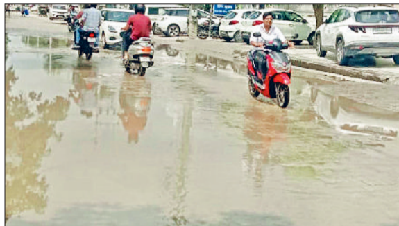
जींद। बारिश के पानी के बीच से गुजरते वाहन।