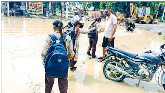
पूंडरी। दूषित पानी से निकलते स्कूली बच्चे।