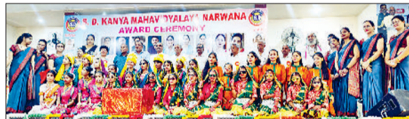
जीद। कार्यक्रम में भाग लेते हुए छात्राएं।

■ नए सत्र का शुभारंभ हवन से बच्चों ने प्रस्तुत किए कार्यक्रम